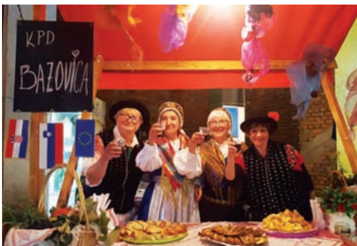
Bogata ponudba KPD Bazovica hitro pošla.