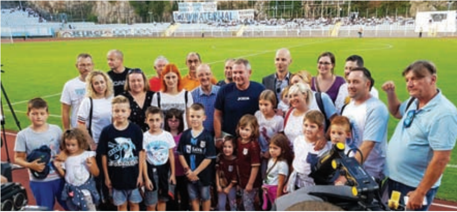
Matjaž Kek posebej razveselil obiskovalce iz društva.

Ž e poleti, ko je potekalo Poletje v Bazovici, je k nam prišla novica, da se bo pod skalami na kulturnem nogometnem stadionu Kantrida 8. septembra odigrala nogometna tekma med kluboma NK Rijeka in NK Maribor. Med poletnim programom smo opazili otroško privrženost športu nasploh, in ker tudi sama prihajam iz mesta ob vznožju Pohorja, smo se odločili, da podmladku društva omogočimo ogled tekme, ki v prijateljskem duhu oznanja sodelovanje sosednjih narodov. Reko in Maribor ne povezuje le priljubljeni nogometni trener NK Rijeka, ki prihaja iz Maribora, Matjaž Kek, temveč imata kluba tudi istega sponzorja. Kot zanimivo povezavo naj omenimo, da je tudi oče reškega župana Vojka Obersnela rojen v Mariboru in še kakšno vez bi se dalo najti. Čez poletje je odmevnost dogodka z geslom Vrnitev na Kantrido naraščala in pričakovanje med Rečani se je stopnjevalo. Beseda je dala besedo in nas pripeljala do srečnega naključja, da je bil med organizatorji dogodka tudi očka dveh deklic, ki redno prihajata v društvo na dejavnosti za otroke. Po nekaj telefonskih klicih in poslanih elektronskih sporočilih, na katere smo z obeh strani prejeli odziv s toplo dobrodošlico, smo od mariborske navijaške skupine Viole prejeli 30 vstopnic za družinsko tribuno, ki so jih namenili našim najmlajšim članom in njihovemu spremstvu. Pošle so v trenutku, obenem pa so nam iz NK Rijeka sporočili, da nas bo sprejel tudi sam trener Kek.