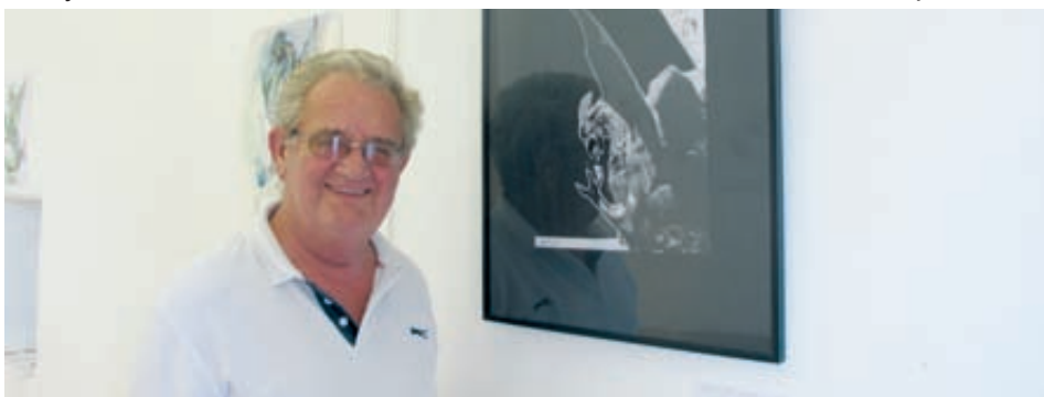
Istog Žorž.