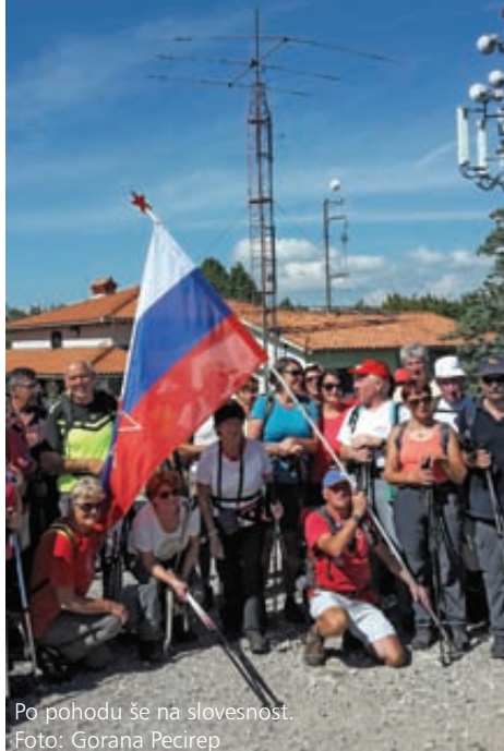
Po pohodu še na slovesnost.