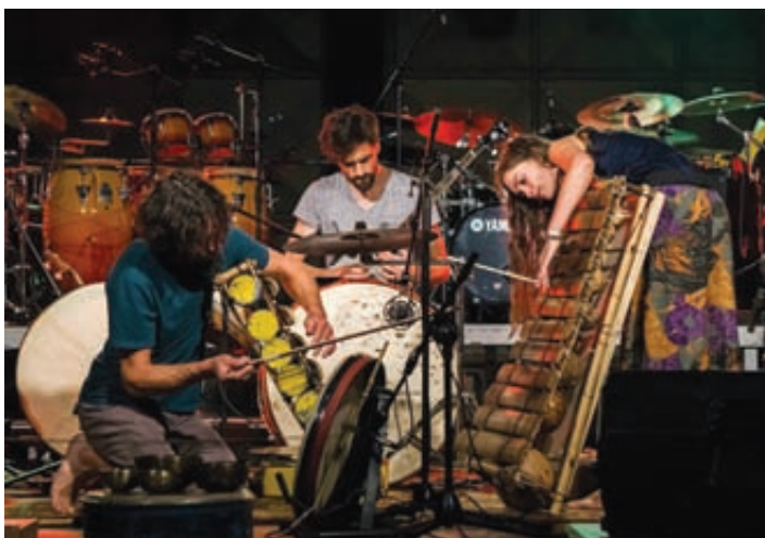
Skupina Širom.