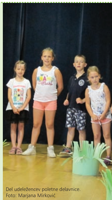
Del udeležencev poletne delavnice.

Obveščamo zainteresirane starše, da lahko tudi v vseh vrtcih na Reki, ki delujejo v okviru javne vzgojno-izobraževalne ustanove Otroški vrtec Reka, izrazijo željo po uvrstitvi svojega otroka v program učenja slovenščine. To pravico narodnim manjšinam zagotavlja zakonodaja RH na vseh vzgojno-izobraževalnih ravneh, tudi predšolski. V pripravi je celodnevni program za vrtec za prihodnje leto, če bo prijavljenih dovolj otrok in zagotovljene ustrezne kadrovske razmere. Zato k sodelovanju vabljeni vzgojiteljice z znanjem slovenščine, informacije v tajništvu KPD Bazovica po elektronski pošti slovenskidom@bazovica.hr ali v uradnih urah na tel. +385 (0)51 215 406.