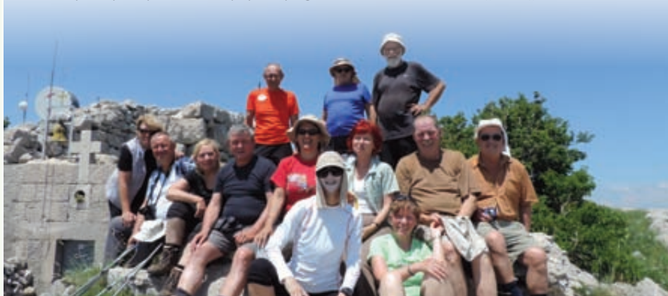
Na vrhu Snježnice.

Po vzponu na najvišji vrh Šipana v Elafitskih otokih pri Dubrovniku planinska skupina počasi končuje projekt vzponov na najvišje vrhove jadranskih otokov. Ostala je samo še Šolta.